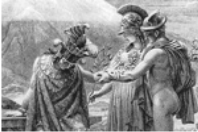
Calcografía según un dibujo de Francios Gérard, 1814

grandes convoyes de barcazas por casi 3.500 kilómetros desde el Pantanal hasta el Río de la Plata, para lo que se hace necesario profundizar los ríos, con dragados permanentes y voladuras de los cauces rocosos para permitir el paso de los convoyes.